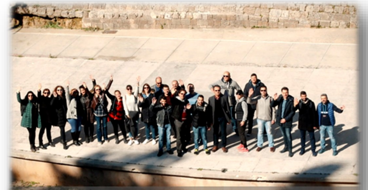
Μεταπτυχιακοί φοιτητές και μεταπτυχιακές φοιτήτριες ακαδ. έτους 2017-18

Καταβολή διδάκτρων, ύψους 3.200€ (τμηματική καταβολή σε δόσεις). Δυνατότητα απαλλαγής από τα τέλη φοίτησης για μεταπτυχιακές/οί φοιτήτριες/ές σε ποσοστό ως 30% του συνολικού αριθμού των φοιτητών/τριών που εισάγονται στο Π.Μ.Σ. σύμφωνα με τα οριζόμενα.