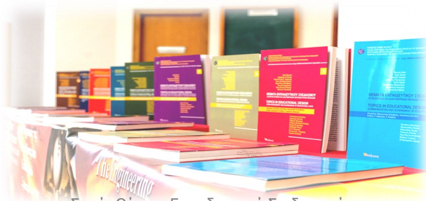
Σειρά: Θέματα Εκπαιδευτικού Σχεδιασμού

Εμπλουτισμός των τυπικών μορφών διδασκαλιών (διάλεξη-εργαστήριο-φροντιστήριο, προσομοίωση, μικροδιδασκαλία, κλπ):