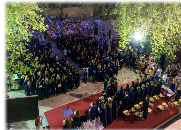
Τελετή Καθομολόγησης Αποφοίτων των Π.Μ.Σ. της Σχολής Ανθρωπιστικών Επιστημών, Πανεπιστήμιο Αιγαίου, Ρόδος

Μεταπτυχιακός Τίτλος Σπουδών Ανώτατης Εκπαίδευσης (2ος Κύκλος Σπουδών)